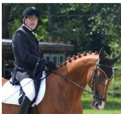
Christoph Eigenmann / Idéal de la Cour

La partie « dressage » du show a permis à Christian Pläge, assisté par les commentaires de son épouse, de montrer les progrès dans la formation de son jeune cheval de dressage très promettant.